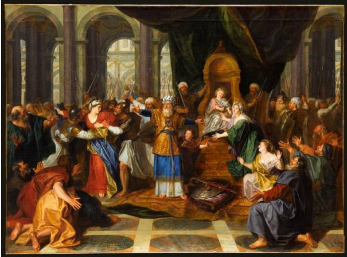
Athalie Chassée du Temple, par Antoine Coypel

A partir des textes et des musiques composées pour la pièce, ce spectacle redonne vie avec l'interprétation « d'époque » à une des plus grandes tragédies du siècle de Louis XIV. Gestuelle baroque, mise en scène, déclamation à la française, redonnent toute leur force aux vers de Racine et nous plongent dans des émotions de notre temps.