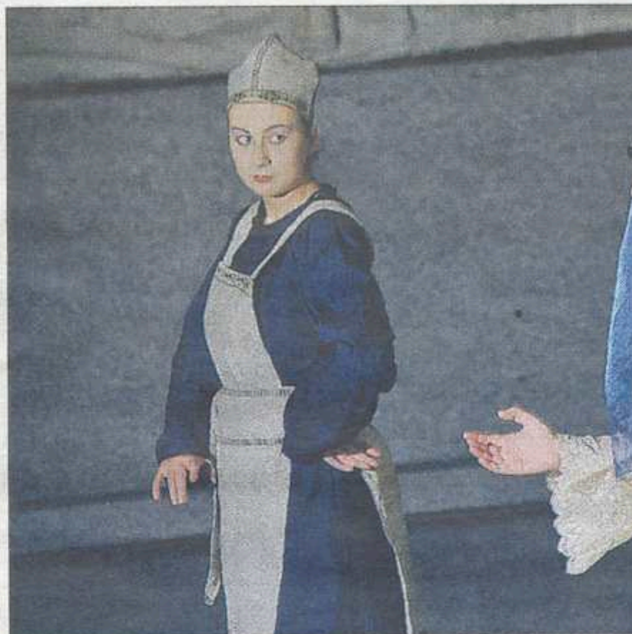
DUO. Deux des quinze jeunes étudiants comédiens dans le p

Le geste précède la parole, puis se fige. Tels des automates, les comédiens déclament. Ils poussent le « S » et assurent la rime dans un phrasé méditerranéen indispensable.